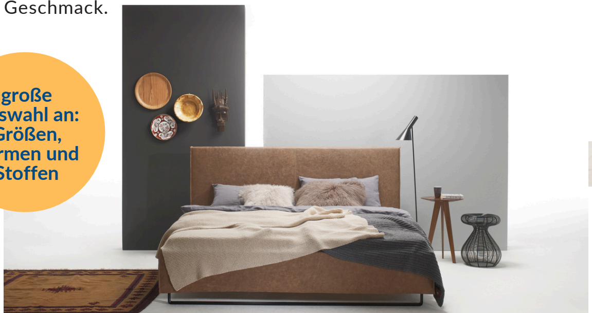
Polsterbett Möller Design

große Auswahl an: Größen, Formen und Stoffen