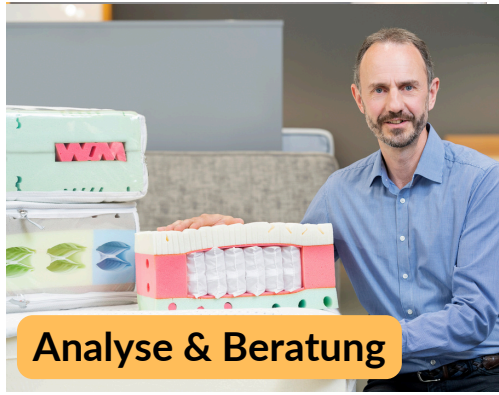
Analyse & Beratung