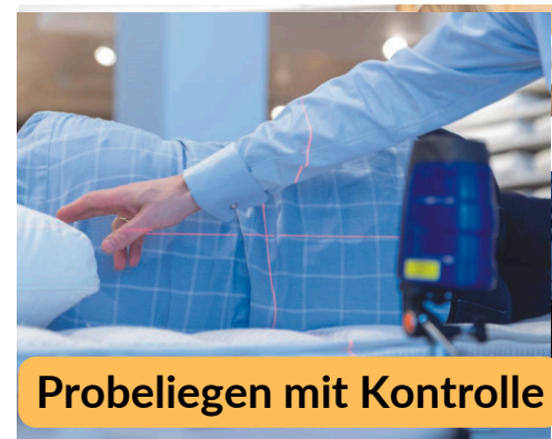
Probeliegen mit Kontrolle